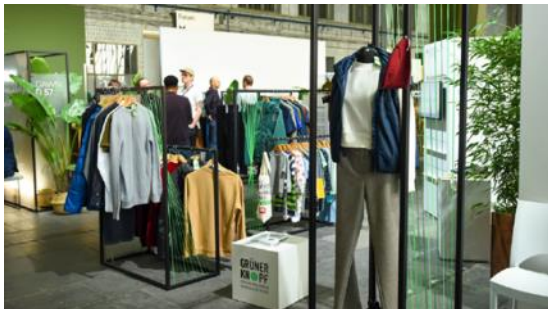
NEONYT, Januar 2020