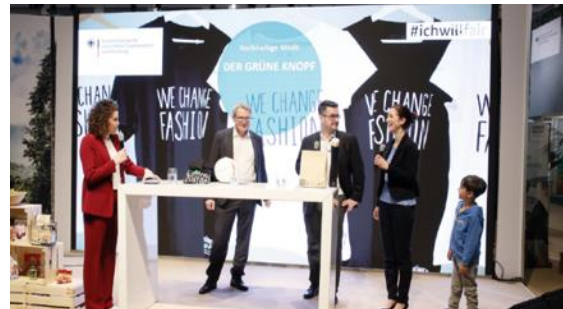
Internationale Grüne Woche, Januar 2020